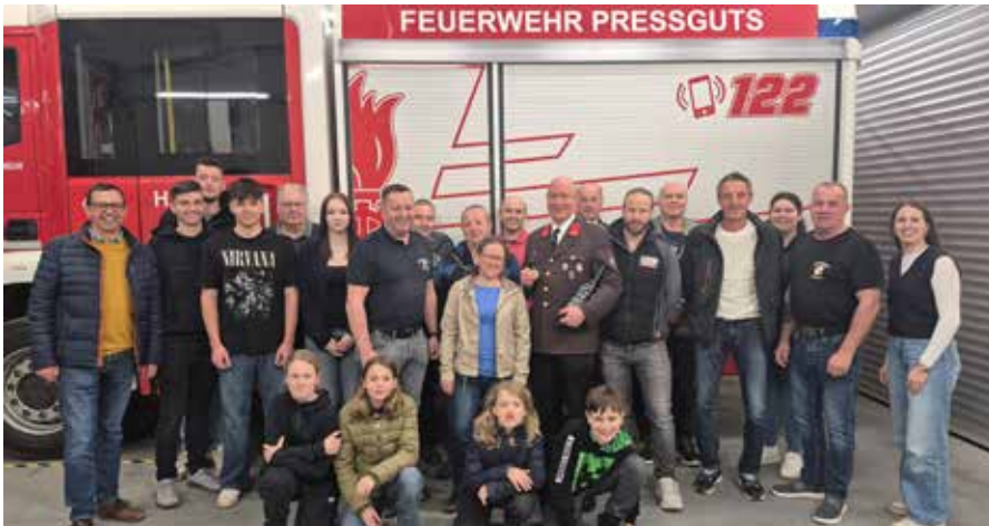
| Erfolgreiche Kommandantenprüfung