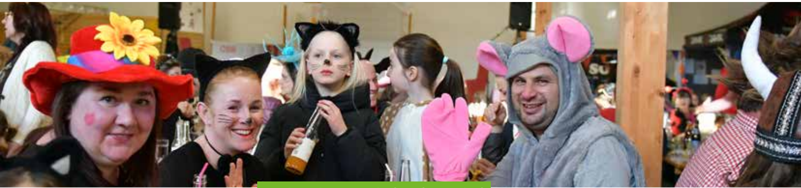
Fasching der FF Neudorf/Großpesendorf