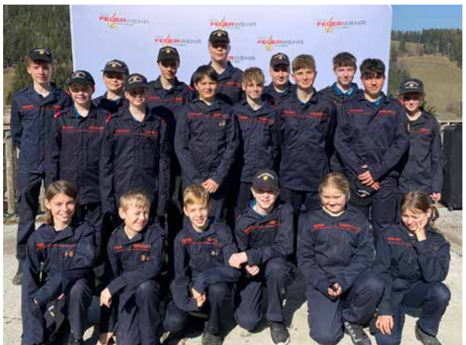
| Wissenstest Heilbrunn