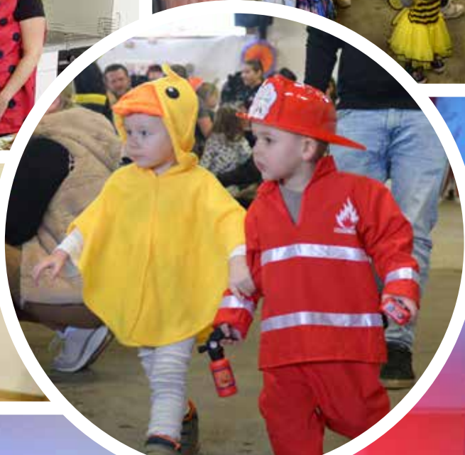
Fasching der FF Neudorf/Großpesendorf