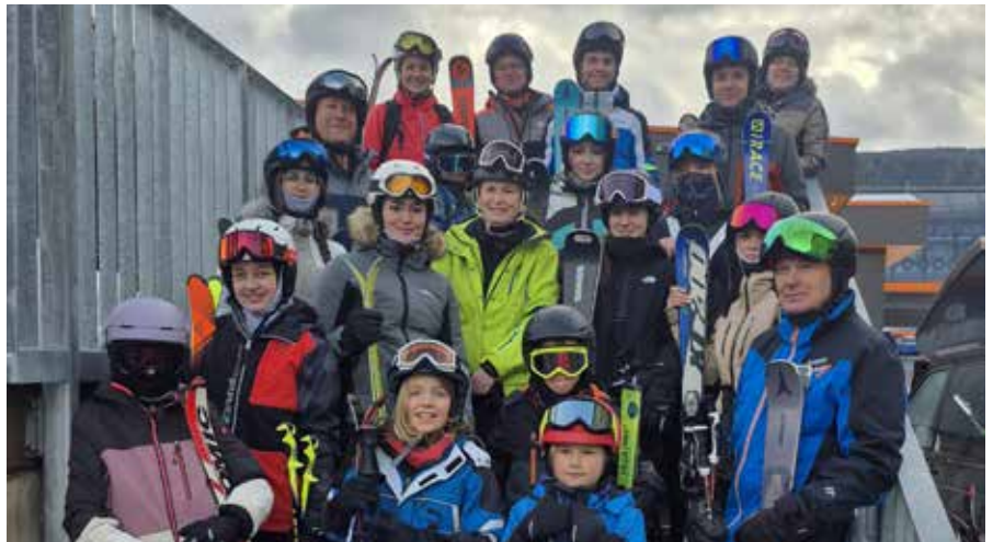
Wintersporttag am Kreischberg

Am Samstag, dem 24. Jänner 2026, nahm die FF Preßguts am Wintersporttag der steirischen Feuerwehren am Kreischberg (BFV Murau) teil. Gemeinsam mit zahlreichen Feuerwehren aus der Steiermark verbrachten Feuerwehrjugend und aktive Mitglieder einen sportlichen und kameradschaftlichen Tag im Schnee. Neben dem sportlichen Aspekt stand vor allem der Gemeinschaftssinn im Mittelpunkt der Veranstaltung.