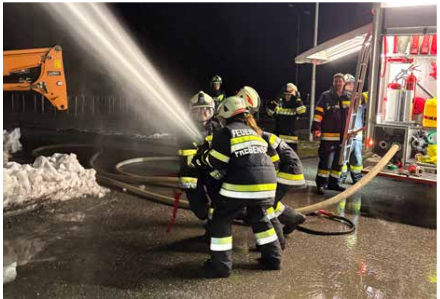
| Monatsübung Brand