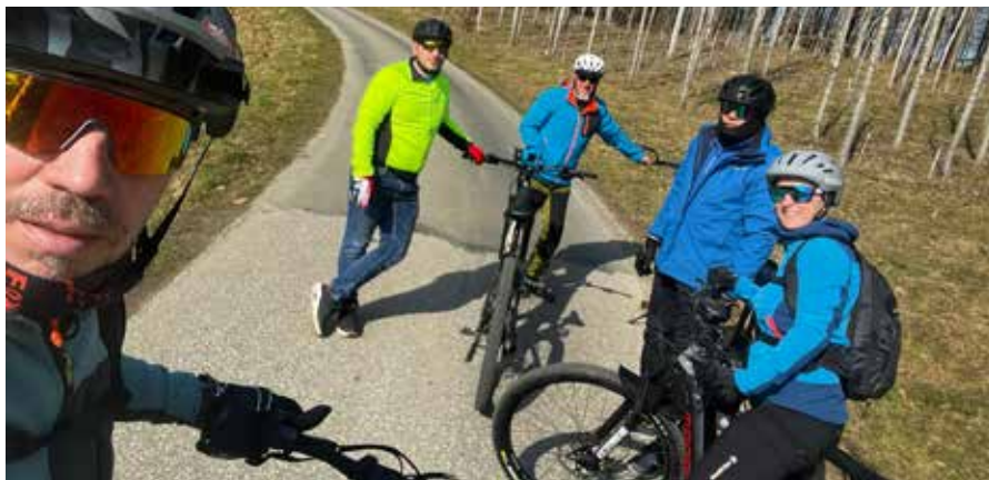
| Get Moving!

Am 7.3.2026 bestand für die Bevölkerung die Möglichkeit bei uns im Feuerwehrhaus, in Kooperation mit „Brandschutz Patrick Schlenner“, ihre Feuerlöscher der notwendigen Wartung und Überprüfung (welche alle zwei Jahre vonnöten ist!) unterziehen zu lassen.