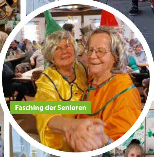
Fasching der Senioren