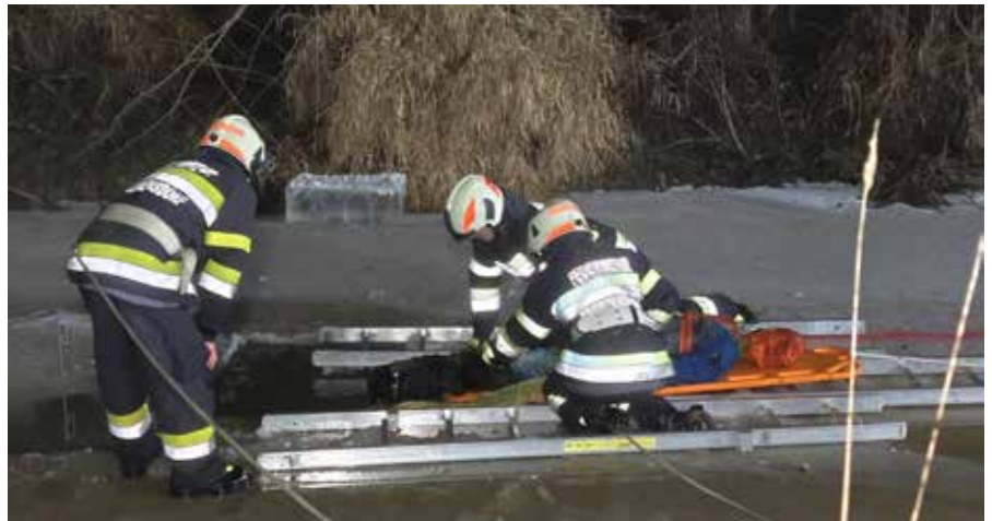
| Schulung Eisrettung