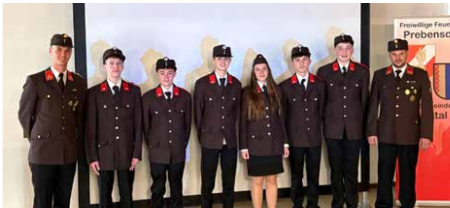
Die frisch angelobten Feuerwehrmänner und -frauen

Am 7. März fand der diesjährige Wissenstest im Bereich Weiz statt, der diesmal von der FF Heilbrunn veranstaltet wurde.